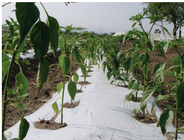
Se usa el abono orgánico en el cultivo de chile ancho.

En los últimos 20 años, Aguascalientes se ha caracterizado por ser una cuenca lechera a nivel nacional. En el año 2003 se tenía un registro de 71,501 cabezas de ganado productor de leche, según datos de SAGARPA (Servicio de Información y Estadística Agroalimentaria y Pesquera). Cruz Medrano, (1986) señala que el bovino de leche produce 20 kg de estiércol por día, lo que equivale a una producción de 1,430 toneladas diarias de estiércol. Las estimaciones totales del contenido de nutrientes del estiércol procedente del ganado lechero son: 23.88 t de N; 15.44 t de P_2O_5 ; 8 t de K_2O y 645 t de materia orgánica (Beltrán Morales et al. , 2004). En consecuencia, se deben proponer alternativas sustentables para la utilización de esa fuente de nutrientes en la producción de cultivos hortícolas bajo sistemas intensivos.