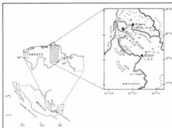
Fig. 1. Reserva de la Biósfera "Los Pantanos de Centla", Tabasco

Esta fase se concentró a 2 ml y se purificó por cromatografía en columna usando alúmina y sulfato de sodio para obtener dos fracciones: la fracción I contiene los hidrocarburos alifáticos o parafinas y se eluyó con hexano; la fracción II abarca los hidrocarburos aromáticos, los cuales se eluyeron con una mezcla de hexano:diclorometano y finalmente diclorometano. Ambas fracciones se concentraron hasta 1 ml, se trasvasaron a viales y se llevaron a sequedad, las dos fracciones se analizaron por cromatografía de gases, empleando